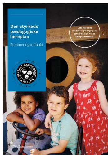
Den styrkede pædagogiske læreplan, Rammer og indhold

Inden for de krav, der følger af dagtilbudsloven, er det op til jer at beslutte, hvordan I konkret vil arbejde med den pædagogiske læreplan. Jeres læreplan skal være et dynamisk og meningsfuldt dokument, som peger fremad, og som I kan bruge aktivt i den løbende udvikling af den pædagogiske kvalitet og jeres pædagogiske praksis.